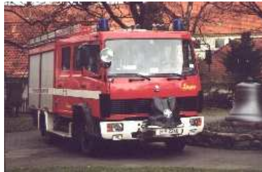
1992 - 2005 LF8 TS

Die frühen Monate des Jahres 1992 ließen die Wehr erstarren, so drohte doch der städtische Rotstift der Wehr den Garaus zu machen. Doch die Geschlossenheit der Wehr und ihrer Förderer sowie das daraus entstandene Medieninteresse lehrten selbiges Schreibgerät das Fürchten, sodass es bald ausgestanden war. Im April 1992 konnte sich die Wehr über ein fabrikneues LF 8 freuen, dessen Einsatzkraft man in den folgenden Jahren nicht nur bei diversen Großeinsätzen zu schätzen wußte.