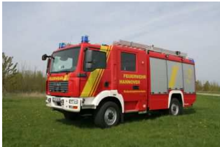
seit 2008 LF 20/16

Das Jahr 2008 brachte zwei bedeutende Veränderungen mit sich. Zum einen erhielten wir ein LF 20/16 im Austausch für das ältere LF 16TS.