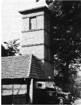
Das Gerätehaus 1888

Die Freiwillige Feuerwehr Kirchrode wurde im Jahre 1888 in einer Kirchroder Gasthaus von einigen Kirchroder Bürgern gegründet. Das Gerätehaus wurde in viel eigener Arbeit aus Holz in der Schwemannstraße gebaut, in der heute, auf diesem Platz, die Garagen der dort ansässigen Stadtparkasse Hannover stehen.