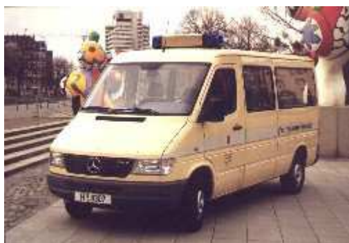
1999 - 2013 Betreuungs-Kombi

Seit 1999 verfügte unsere Betreuungskomponente über einen Sprinter.