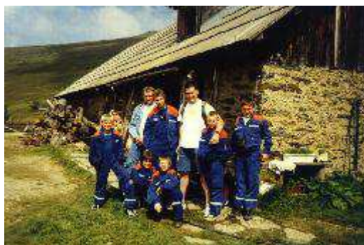
JF Kirchrode in Österreich