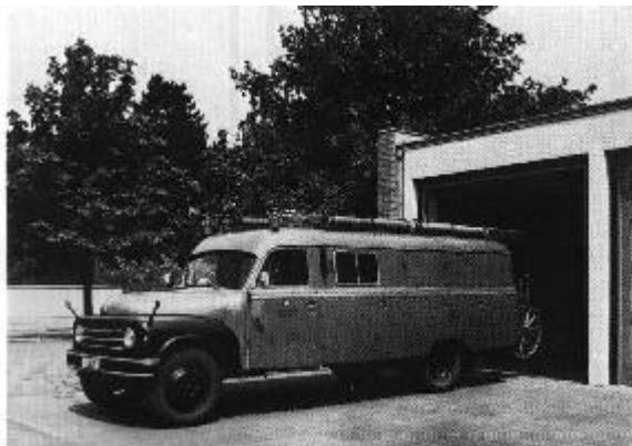
1962 - 1975 Hanomag LF 8 - TS

Für das neue Gerätehaus wurde auch ein neues Fahrzeug beschafft. Diesmal von der damals in Hannover ansässigen Firma Hanomag. Es war ein Löschgruppenfahrzeug mit einer Pumpenleistung von 800l/min.