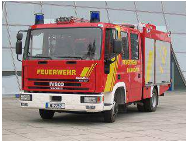
seit 2005 LF 10/6

und die Grundsteinlegung des neuen gemeinsamen Gerätehauses, mit der Bemeroder Ortsfeuerwehr. Ansonsten war in diesem Jahr erneut die Interschutz zu Gast in Hannover und sorgte für viel Arbeit. 2006 war das Feuerwehrhaus fertiggestellt. Im September wurde es mit einem Festakt eingeweiht.