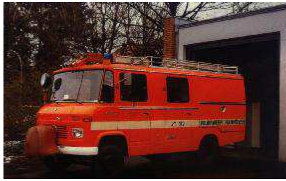
1975 - 1992 LF 8 - TS

Im Jahre 1978 wurden die ersten Funkmeldeempfänger beschafft. Sie waren für eine stille Alarmierung gut. Das heißt, das ab 1978 nicht mehr nur über Sirene alarmiert wurde, sondern hauptsächlich über diese kleinen Pieper. 1979 erkannte man die Notwendigkeit einer Jugendfeuerwehr zum Zwecke der Nachwuchsgewinnung. Einige Mitglieder der daraufhin gegründeten Jugendfeuerwehr, sind bis heute in der Ortsfeuerwehr.