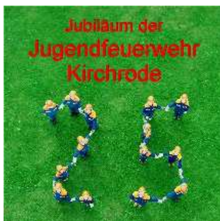
Plakat zum Fest

Im Jahr 2004 feierte die JF ihr 25 jähriges Bestehen.