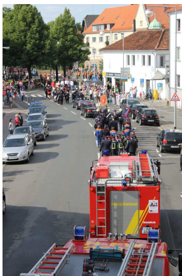
Festumzug 125 Jahre OFw Kirchrode

Ebenfalls im Jahr 2013 konnte die Fachgruppe Betreuung und Verpflegung zwei neue Fahrzeuge in Empfang nehmen. Der Betreuungs-Lkw und der Betreuungskombi wurden durch einen GW-Logistik und einen MTW ersetzt.