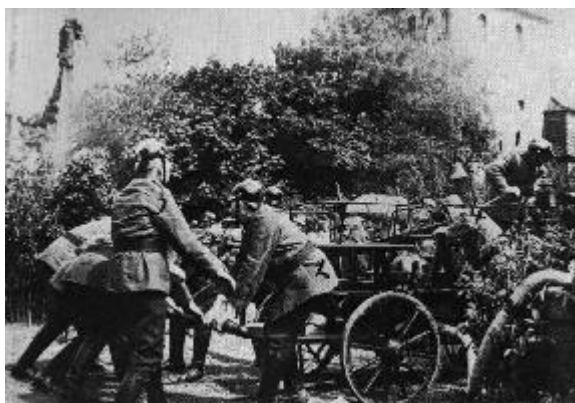
1896 - 1936 Saug- und Druckpumpe

1914 begann der 1. Weltkrieg. Dies lichtete die Reihen der Feuerwehr Kirchrode. 1928 wurde von der Stadt Hannover dem Löschbezirk ein Steigerturm mit Schlauchtrockenvorrichtung erbaut. Durch die gesetzlichen Änderungen im Jahre 1933, war eine Reorganisation der Feuerwehr notwendig. Alle Kameraden, die das 65. Lebensjahr überschritten hatten, wurden automatisch in die Altersabteilung versetzt. 1936 wurde wieder ein neues Fahrzeug beschafft, da die Saug- und Druckpumpe allmählich ihren Geist aufgab. Es war ein sogenannter KKs.