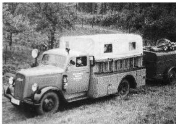
1948 - 1962 OPEL Blitz mit TSA

In der darauffolgenden Zeit war aufgrund des neuen Fahrzeuges ein ausgiebiger Übungsdienst erforderlich. Im Jahre 1948 wurde wieder ein neues Fahrzeug beschafft. Es war ein OPEL Blitz mit Tragkraft-Spritzen-Anhänger (TSA). Diesen behielten wir von 1948 bis 1962.