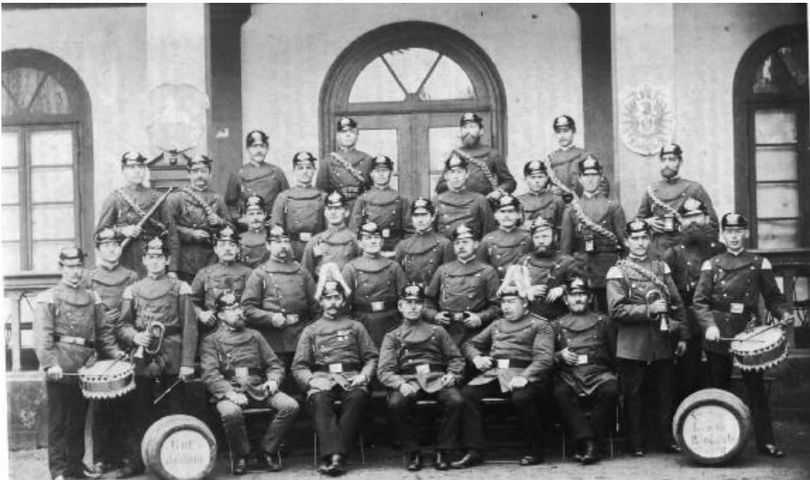
Foto: Die Gründungsmitglieder 1888

Die Gründungsmitglieder des damaligen Löschbezirks Kirchrode wollten eine Gemeinschaft aufbauen, die Mensch und Tier in Notsituationen hilft. Und da kam eine Feuerwehr gerade recht.