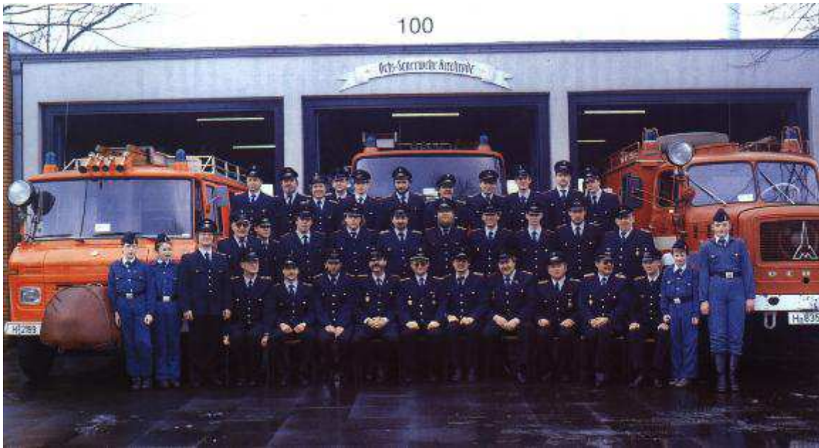
Die aktive und Jugendabteilung der Ortsfeuerwehr Kirchrode 1988